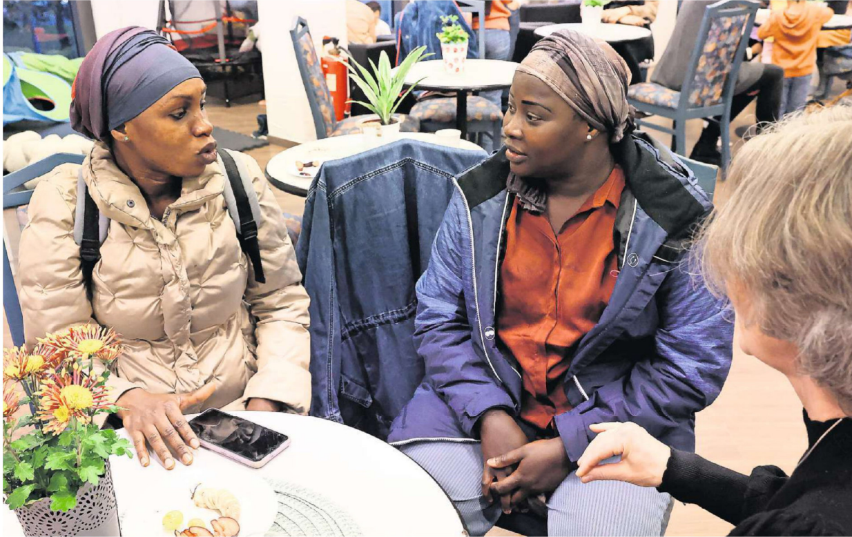
Flux ist in Hildesheim mehrfach und in unterschiedlicher Form zu finden: Einmal in der Senkingstraße, wo es viele Beratungen, aber auch Sprachunterricht und Freizeitangebote gibt. Und dann im Hi.Punkt, einem Begegnungszentrum, das im Januar aus der Arneken Galerie ins ehemalige Restaurant Miara umgezogen ist.